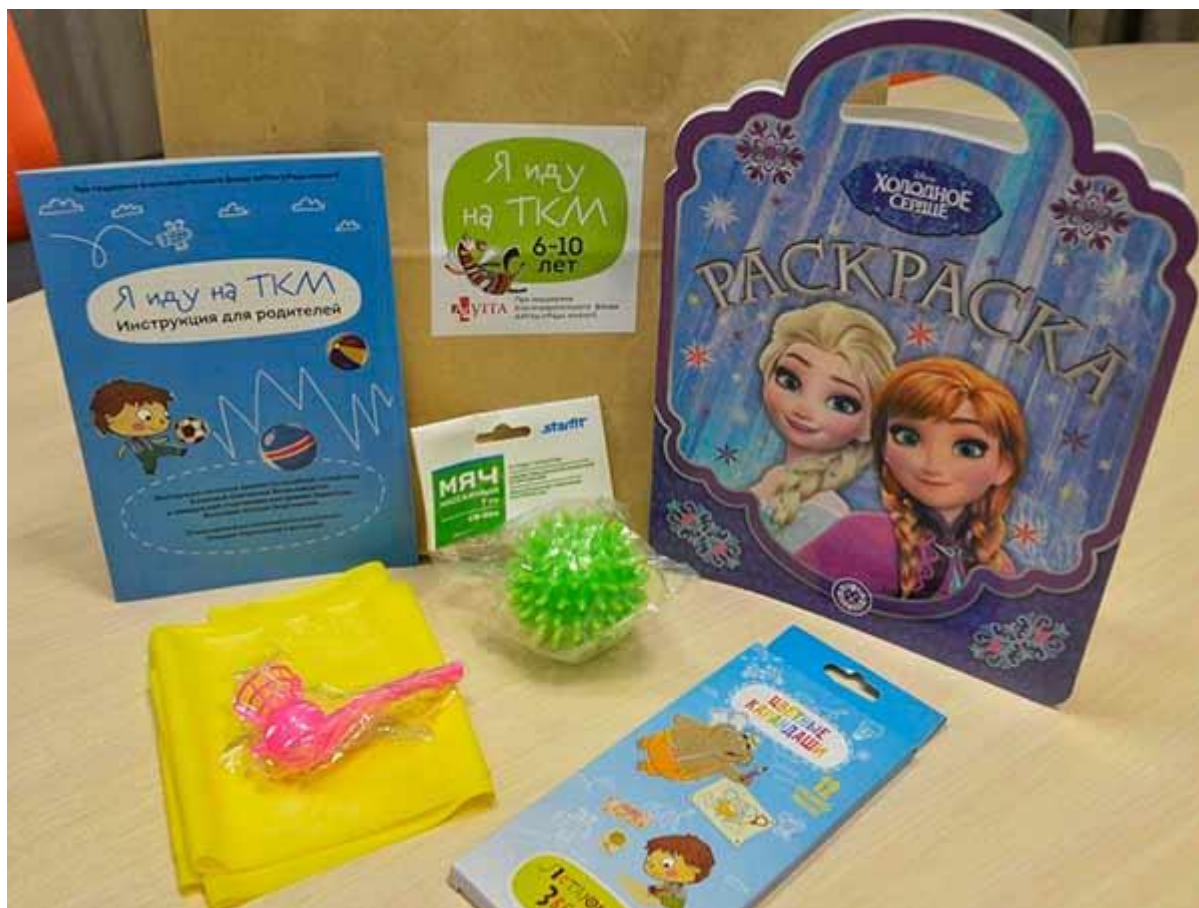
Набор «Я иду на ТКМ»: массажный мячик, дыхательный тренажер, лента-эспандер и раскраски

В 2021 году к программе помощи подопечным добавится комплексное психологическое сопровождение – как профессиональное, так и товарищеское, от людей, у которых есть опыт онкологического заболевания. Проекты по товарищеской и профессиональной психологической поддержке дополняют друг друга. Они будут запущены уже в 2021 году, хотя были продуманы и подготовлены к запуску во второй половине 2020 года. Равный консультант — это человек с опытом жизни с онкологическим заболеванием, готовый делиться этим опытом с другими людьми. Профессиональную психологическую помощь подопечным и близким мы сможем оказывать благодаря партнерству с платформой Alter, которая занимается подбором психологов и психотерапевтов.